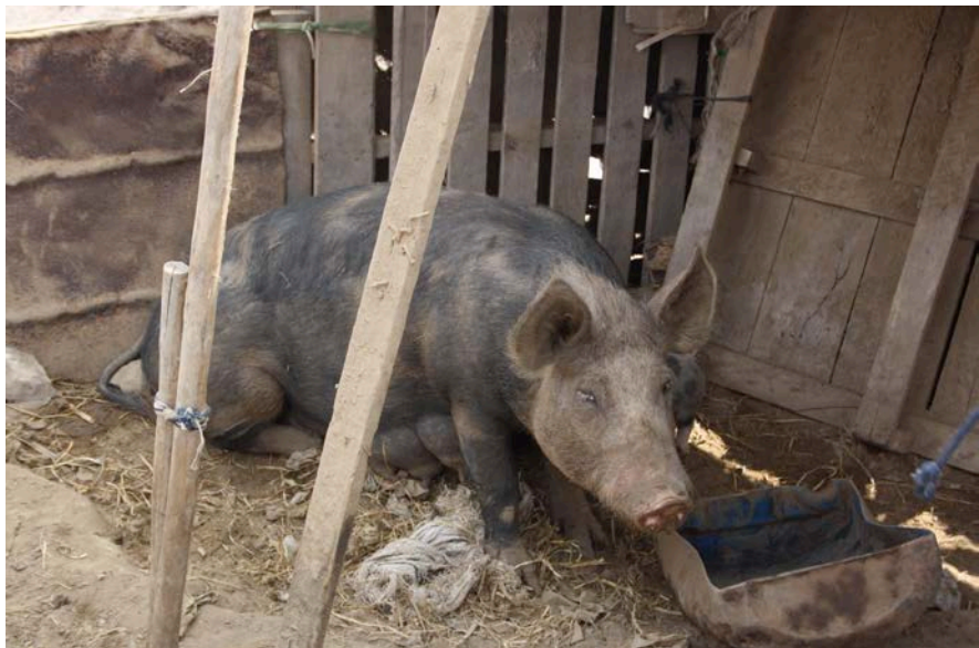
Botaron a los chanchos con amenazas