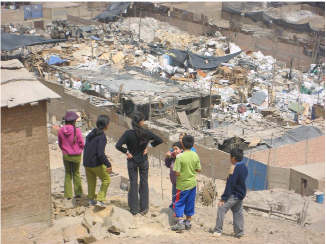
Chanchería hace mal para el medio ambiente

El criador de chanchos dice que sí va a haber chanchos con alimentos balanceados y que para eso tienen que construir chozas con esteras y con el piso pulido.