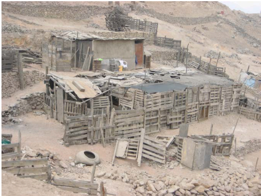
El mal olor de la chanchería