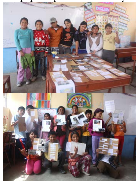
El equipo de prensa de Puckllay