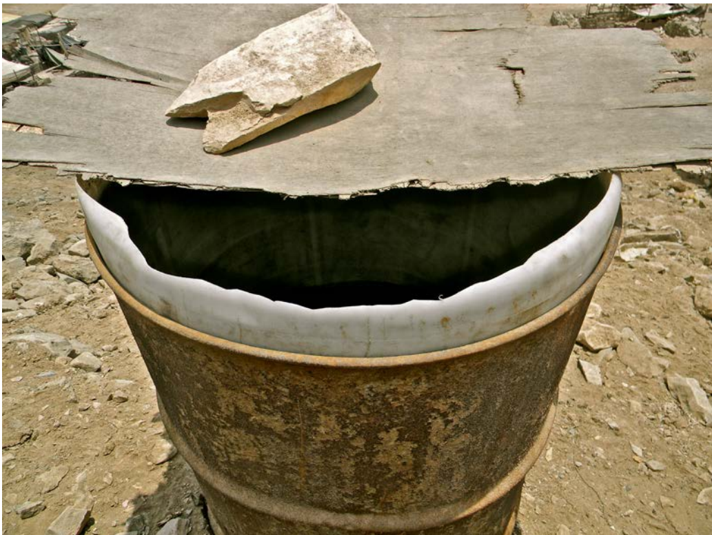
El agua necesita pasar por filtros para llegar limpia a las casas.